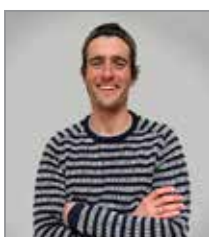
Nagai Puntiverio Boardsport