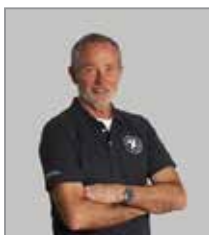
Per Baagø Sejlads, jolle+