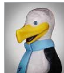
HMI Mågen Mogens Mascot