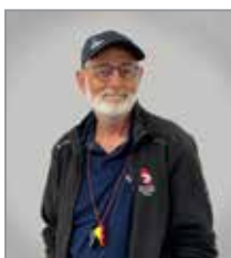
Finn Beton Jolle+